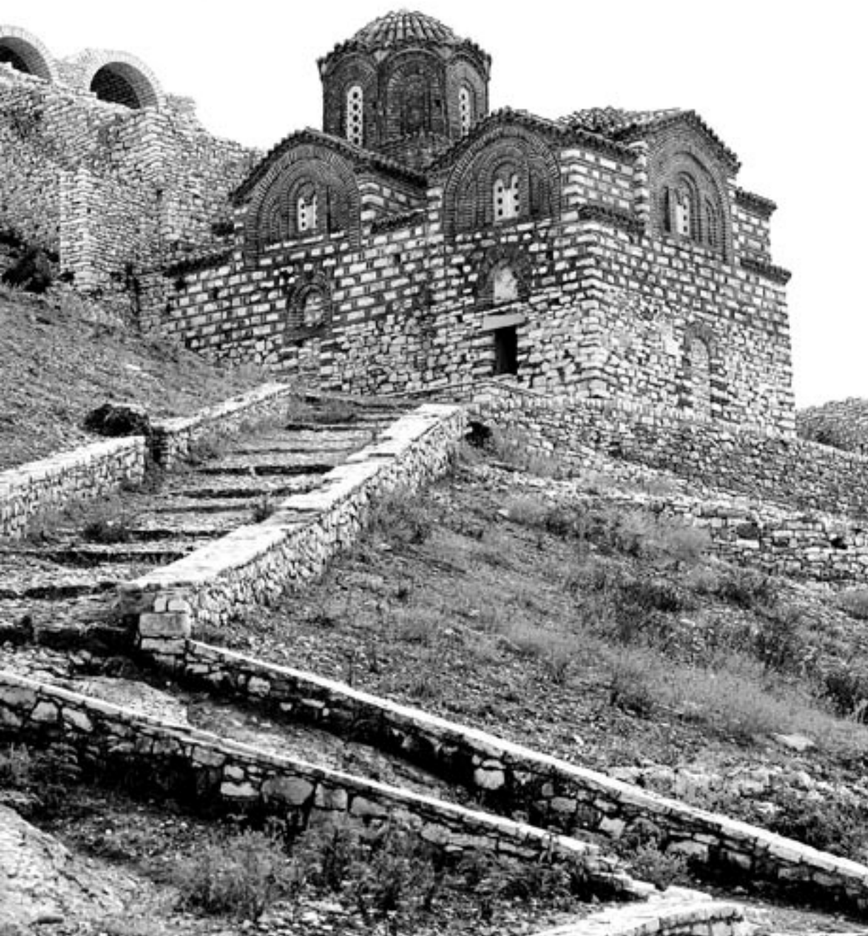
Црква Свете Тројице у Берату, Албанија